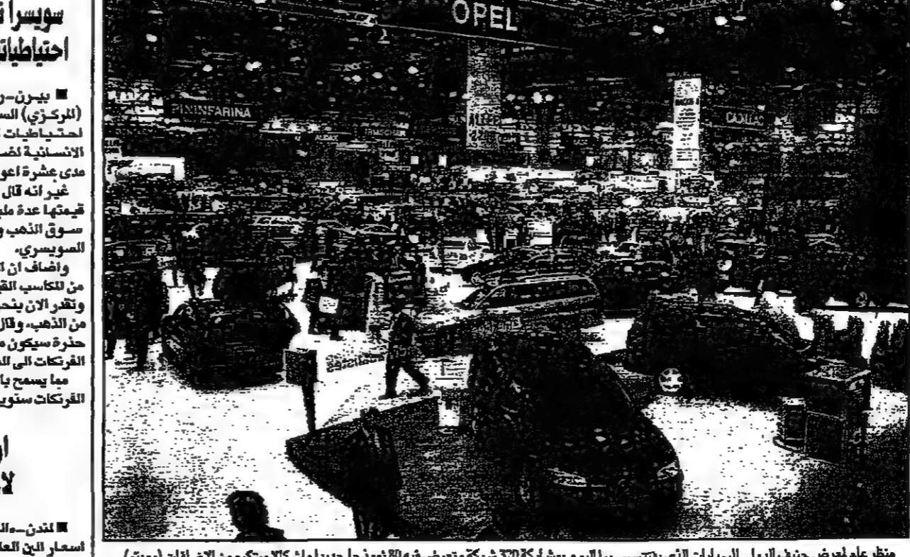
منظر عن عرض جديف الدولي للسيارات الذي ينتظر رسمياً اليوم بمشاركة 300 شركة وتعرض فيه 80 نموذجاً جديداً ولشكلاً متكرره من الامتدادات